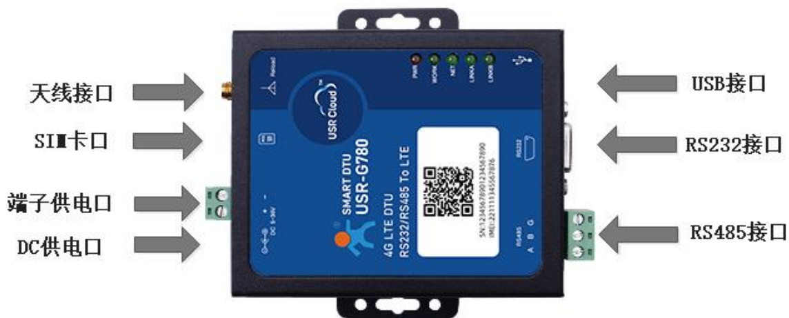
图 2. USR-G780 V2 接口图